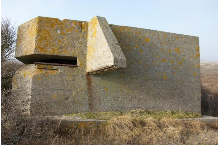
Afb. 2. De meetpost

De bezetters vonden deze manier van werken te ingewikkeld voor een kustbatterij en haalden het